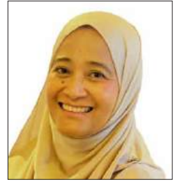
سعادة الأستاذ الدكتور ساليينا قاسم عميد معهد المالية والمصرفية الإسلامية بالجامعة الإسلامية العالمية ماليزيا