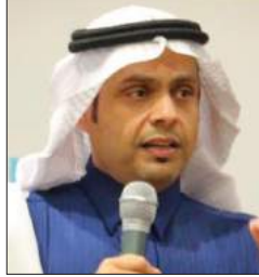
سعادة الأستاذ إبراهيم بن ناصر المعطش الرئيس التنفيذي للمركز السعودي للمسؤولية الاجتماعية