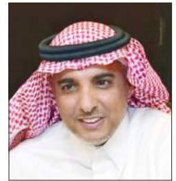
سعادة الدكتور فهد بن علي العليان رئيس مجموعة المسؤولية الاجتماعية بنك الجزيرة - المملكة العربية السعودية