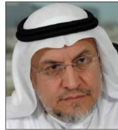
سعادة الدكتور عمر زهير حافظ رئيس مجلس إدارة الوكالة الإسلامية الدولية للتصنيف