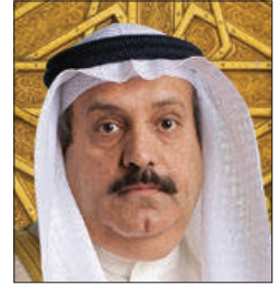
سعادة السيد عدنان أحمد يوسف الرئيس التنفيذي لمجموعة البركة المصرفية السفير الدولي للمسؤولية المجتمعية - العضو الشرعي للاتحاد الدولي للمسؤولية المجتمعية الراعي الفخري للمؤتمر