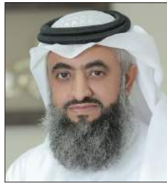
سعادة الدكتور عبدالوهاب الزهراني خبير التنمية المستدامة مؤسس مؤسسة جسور للتنمية