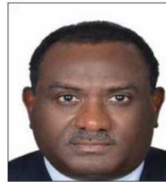
سعادة الدكتور أزهرى قاسم كبير الاقتصاديين صندوق التضامن الإسلامي للتنمية البنك الإسلامي للتنمية