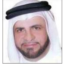
سعادة الأستاذ الدكتور علي آل إبراهيم أستاذ إدارة الأعمال- نائب رئيس الشبكة الإقليمية للمسؤولية الاجتماعية