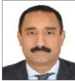
سعادة الدكتور هاشم حسين رئيس مكتب ترويج الاستثمار والتكنولوجيا في منظمة الأمم المتحدة للتنمية الصناعية 'اليونيدو' ضيف الشرف