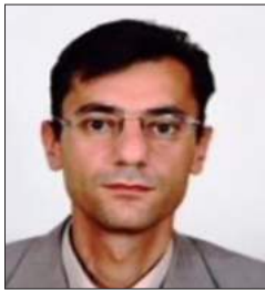
سعادة الدكتور محمد أحمد الصديق استاذ مساعد في الاقتصاد - عميد كلية الاقتصاد والإدارة جامعة سليمان الدولية