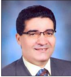
سعادة البروفيسور أشرف دوابة رئيس الأكاديمية الأوروبية للتمويل والاقتصاد الإسلامي (إيفي)