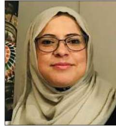
سعادة الأستاذة علا الكحلوت أكاديمية وباحثة في مجال الاقتصاد الإسلامي