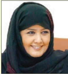
سعادة الشيخة حصة بنت خليفة بن أحمد آل ثاني المبعوث الخاص للأمين العام للشؤون الإنسانية بجامعة الدول العربية - دولة قطر