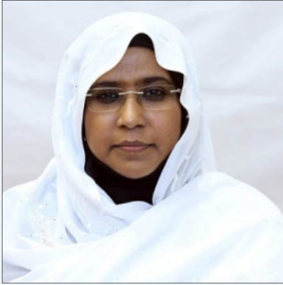
معالي السيدة مشاعر أحمد الأمين الدولب وزيرة الضمان والتنمية الاجتماعية وزارة الضمان والتنمية الاجتماعية ضيف شرف المؤتمر جمهورية السودان