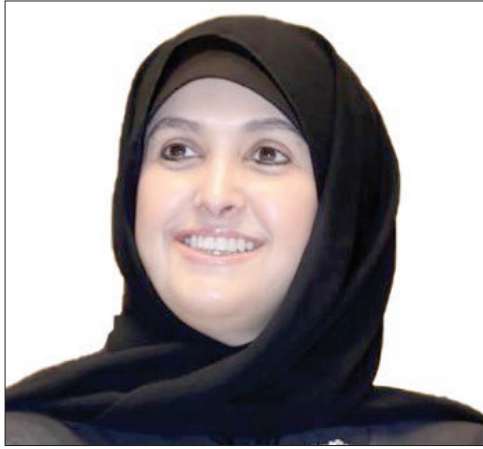
سعادة الشيخة سهيلة بنت سالم الصباح السفير الدولي للمسؤولية المجتمعية دولة الكويت