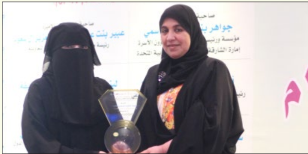
تكريم سعادة الشيخة الدكتورة العنود بنت محمد آل ثاني - مديرة تعزيز الصحة والأمراض غير الانتقالية - وزارة الصحة - دولة قطر