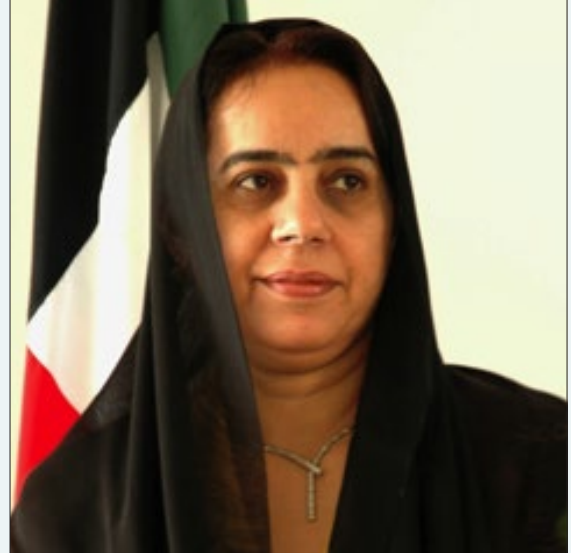
سعادة الدكتورة ربيعة عبيد غباش أستاذ الطب النفسي رئيسة جامعة الخليج العربي سابقاً - مؤسس متحف المرأة ضيف شرف المؤتمر الامارات العربية المتحدة