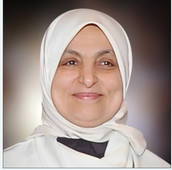
معالي السيدة هند الصبيح وزيرة الشؤون الاجتماعية والعمل وزير الدولة للشؤون الاقتصادية الراعي الفخري للمؤتمر دولة الكويت