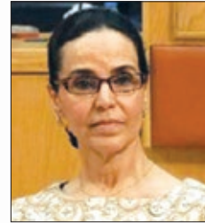
سمو الشيخة أمثال الأحمد الجابر الصباح رئيسة مجلس الإدارة، مركز الكويت للعمل التطوعي دولة الكويت