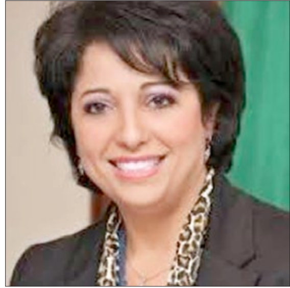
معالي السيدة فاطمة الزهراء زرواتي وزيرة البيئة والطاقات المتجددة - وزارة البيئة والطاقات المتجددة - السفير الدولي للمسؤولية المجتمعية الجمهورية الجزائرية الديمقراطية الشعبية