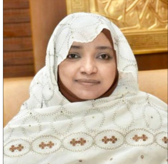
سعادة الدكتورة أمل البكري البيلي وزيرة التنمية الاجتماعية بولاية الخرطوم وزارة التنمية الاجتماعية - السفير الدولي للمسؤولية المجتمعية - جمهورية السودان