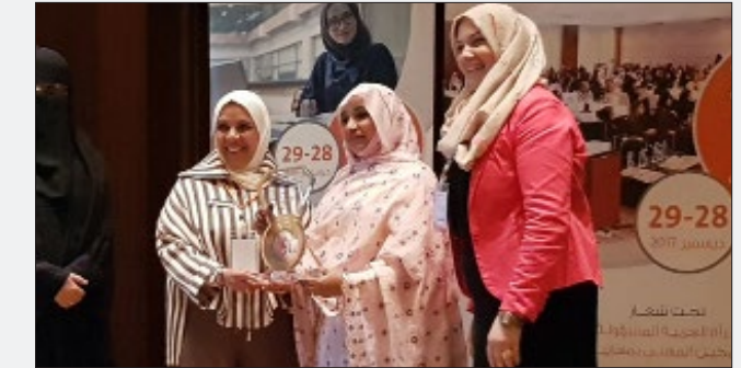
تكريم سعادة الأستاذة معالي العسوس، متخصصة في العمل الإنساني - سفيرة الخير - الفائزة بجائزة صناع الأمل في الوطن العربي - دولة الكويت