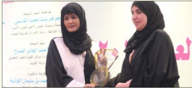
تكريم سعادة الشيخة حصة بنت خليفة بن أحمد آل ثاني - المبعوث الخاص للأمين العام للشؤون الإنسانية بجامعة الدول العربية - دولة قطر