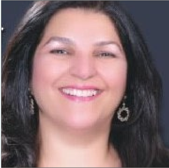
سعادة الدكتورة نعيمة القصير ممثلة منظمة الصحة العالمية في السودان ضيف شرف المؤتمر مملكة البحرين