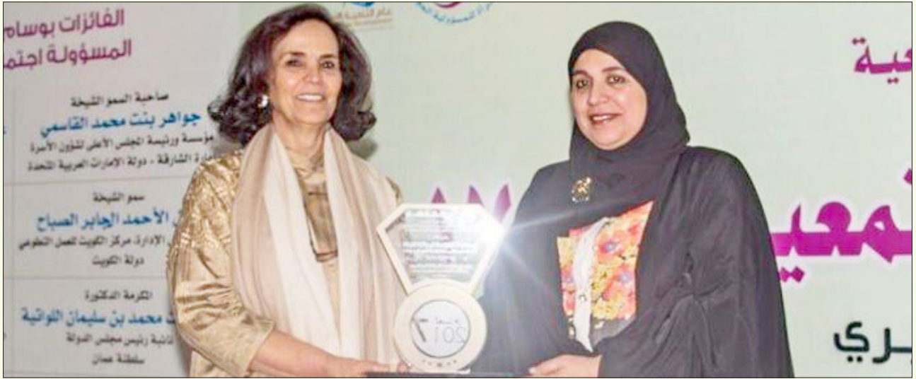
تكريم سمو الشيخة أمثال الأحمد الجابر الصباح رئيسة مجلس الإدارة، مركز الكويت للعمل التطوعي - دولة الكويت