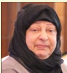
سعادة الشيخة هيا بنت علي آل خليفة عضو مجلس إدارة جمعية الأمومة والطفولة مملكة البحرين