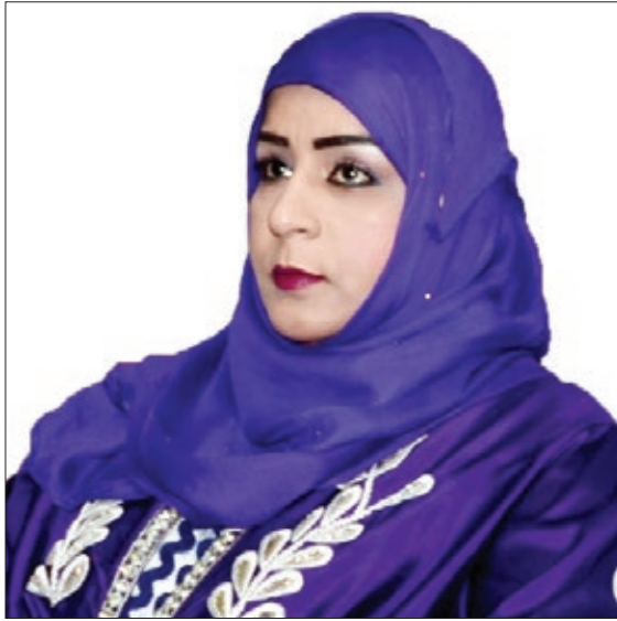
معالي الشيخة عائشة بنت خلفان السيابية رئيسة الهيئة العامة للصناعات الحرفية السفير الدولي للمسؤولية المجتمعية سلطنة عمان