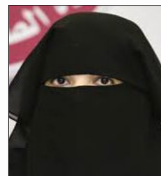
سعادة الشيخة الدكتورة العنود بنت محمد آل ثاني مديرة تعزيز الصحة والأمراض غير الانتقالية - وزارة الصحة دولة قطر