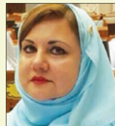
المكرمة الدكتورة سعاد بنت محمد بن سليمان اللواتية نائبة رئيس مجلس الدولة سلطنة عمان