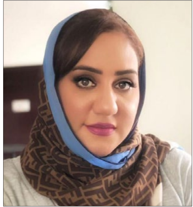
صاحبة السمو السيدة

السفير الدولي للمسؤولية المجتمعية المملكة العربية السعودية