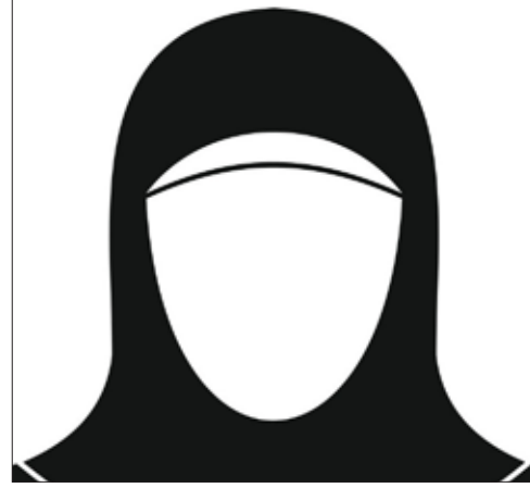
صاحبة السمو الأميرة نورة بنت محمد بن سعود آل سعود رئيسة اللجنة النسائية للتنمية المجتمعية بإمارة الرياض - حرم أمير منطقة الرياض