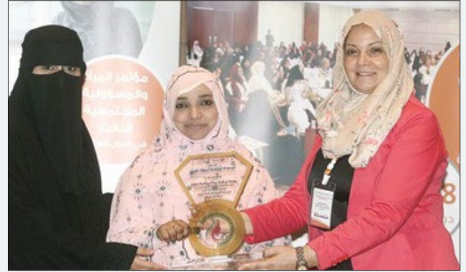
تكريم سعادة الدكتورة أمل البكري البيلي، وزيرة التنمية الاجتماعية بولاية الخرطوم - وزارة التنمية الاجتماعية - السفير الدولي للمسؤولية المجتمعية - جمهورية السودان