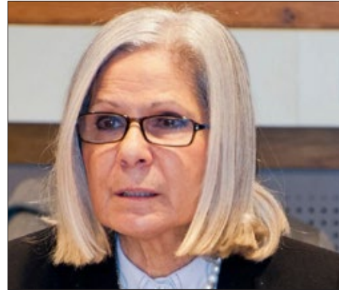
معالي السفيرة الدكتورة هيفاء ابوغزالة الأمين العام المساعد رئيس قطاع الشؤون الاجتماعية جامعة الدول العربية