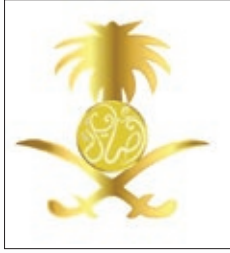
صاحبة السمو الملكي الأميرة عبير بنت عبد الله بن عبدالعزيز آل سعود رئيسة مجلس إدارة جمعية أصايل التعاونية المملكة العربية السعودية