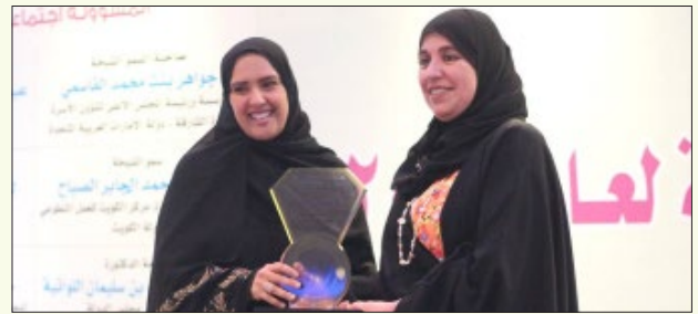
تكريم معالي الشيخة لبنى بنت عبدالله بن خالد آل خليفة رئيسة جمعية تنمية المرأة البحرينية - مملكة البحرين