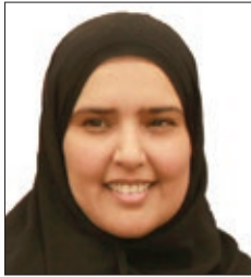
معالي الشيخة لبنى بنت عبد الله بن خالد آل خليفة رئيسة جمعية تنمية المرأة البحرينية مملكة البحرين