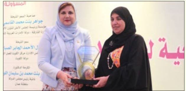
تكريم المكرمة الدكتورة سعاد بنت محمد بن سليمان اللواتية نائبة رئيس مجلس الدولة - سلطنة عمان