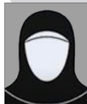
الأستاذة هناء فلاح الجهني