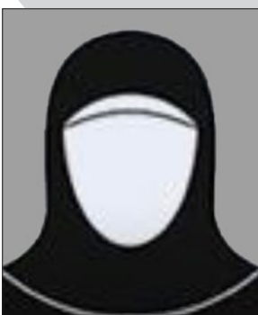
الأستاذة عواطف شديد البشري