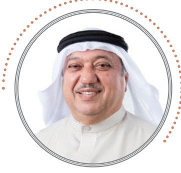
البروفيسور يوسف عبدالغفار الأكاديمي الدولي رئيس مجلس إدارة الشبكة الإقليمية للمسؤولية الاجتماعية