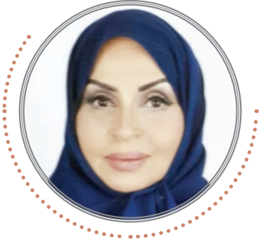
الدكتورة نعيمة الفغنام الأكاديمية التربوية والخبرة في مجالات المسؤولية المجتمعية