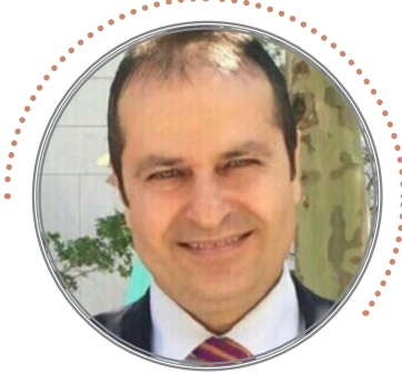
الدكتور محمد الشيباب الأكاديمي والخبير البيئي الدولي الأردني