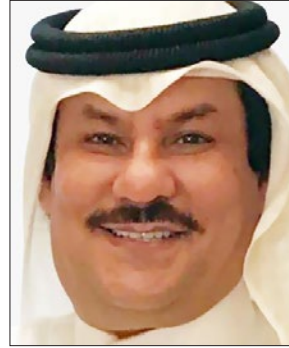
المستشار عبدالله ضعيان العنزي