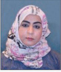
معالي الشيخة عائشة بنت خلفان السايية رئيسة الهيئة العامة للصناعات الحرفية