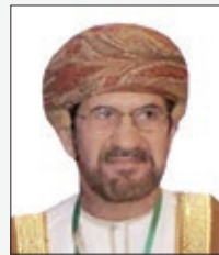
سعادة الشيخ علي بن ناصر المحروقي أمين عام مجلس الشورى