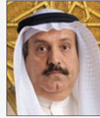
سعادة الأستاذ عدنان أحمد يوسف الرئيس التنفيذي لمجموعة البركة المصرفية