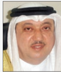
سعادة البروفيسور يوسف عبدالغفار رئيس مجلس إدارة الشبكة الإقليمية للمسؤولية الاجتماعية