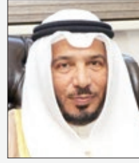
معالي الدكتور عبدالله المعتوق رئيس الهيئة الخيرية الإسلامية العالمية