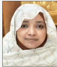
سعادة الدكتورة أمل البكري البيلي وزيرة سابقة وأكاديمية وخبيرة في مجال المسؤولية المجتمعية