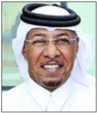
سعادة الدكتور سيف بن علي الحجري مؤسس ورئيس برنامج أصدقاء الطبيعة