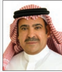
سعادة الدكتور يوسف بن عثمان الحزيم الأمين العام لمؤسسة العنود الخيرية، والرئيس التنفيذي لمؤسسة العنود للاستثمار