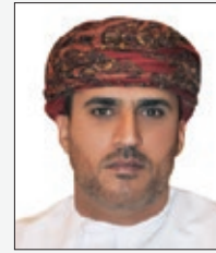
سعادة الشيخ عبدالله بن سالم الرواس رئيس المؤسسة الدولية للتنمية المستدامة