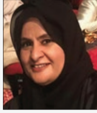
سعادة الشيخة لولوة بنت خليفة بن علي آل خليفة نائبة رئيس جمعية النور للبر