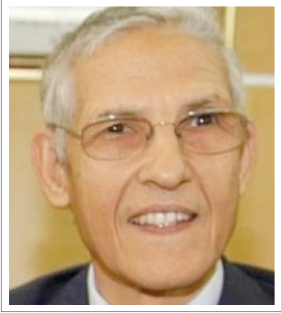
سعادة الوزير لحسن الداودي وزير الشؤون العامة والحكومة المغربي المملكة المغربية نائب ضيف الشرف