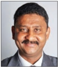
سعادة المهندس طارق حمزة الرئيس التنفيذي لمجموعة سوداتيل