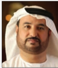
سعادة الأستاذ جمال البح رئيس منظمة الأسرة العربية