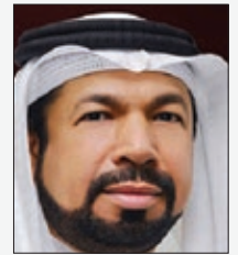
سعادة الدكتور صلاح علي محمد عبدالرحمن وزير وبرلماني سابق